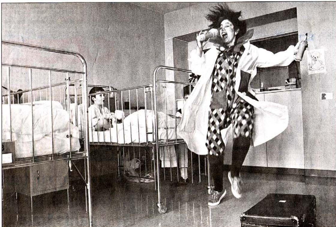
HOPITAUX «Les Docteurs Rêves» s'adressent à tous les jeunes malades. Avec leur bonne humeur, leur pitrerie parfois, leur inventivité surtout, ils font un pied de nez à la souffrance. Magali Koenig

Parmi les équipes, plusieurs seront composées avec les clowns des hôpitaux. Peut-être verra-t-on Docteur Toc Toc, Docteur Chaussettes ou Docteur Sparadrapp mettre des fleurs, des soleils ou des ballons multicolores sur la neige. Car, grâce à eux, tout devient possible, même de rêver... éveillée.